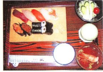
生寿し7カン 巻物 野菜サラダ 茶碗蒸し 吸物