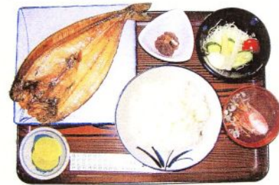
小鉢 野菜サラダ ライス 香物 汁物