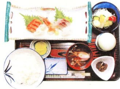
小鉢 野菜サラダ 茶碗蒸し ライス 香物 汁物