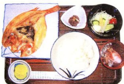
小鉢 野菜サラダ ライス 香物 汁物