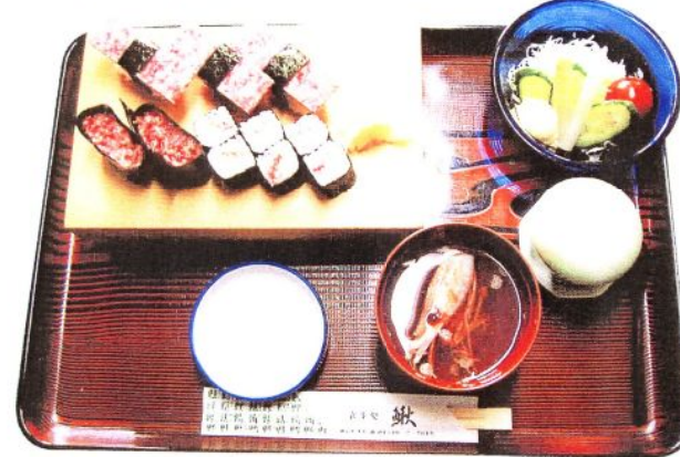
軍カン2コ 野菜サラダ にぎり3コ 茶碗蒸し 巻物1本 吸物