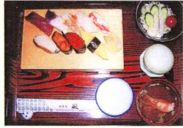
特上ネタ 生寿し9カン 野菜サラダ 茶碗蒸し 吸物