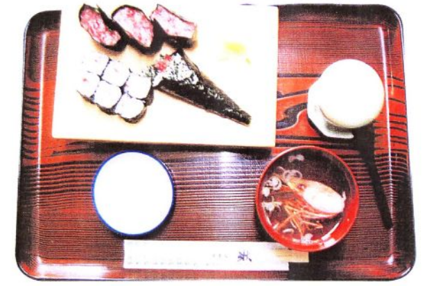
軍カン3コ 茶碗蒸し 手巻1本 細巻1本 吸物